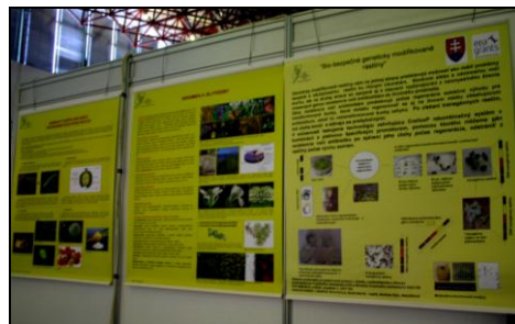
Table shows the list of isolated promoters and their characterisation.

V rámci popularizačných aktivít sme sa prezentáciou v podobe posteru zúčastnili medzinárodného veľtrhu "Veda - vzdelávanie – Inovácie", ktorý sa konal v dňoch 16. - 19. apríla 2009 na výstavisku Agrokomplex v Nitre. Poster presentation in the frame of International exhibition "Science – Education – Innovation".